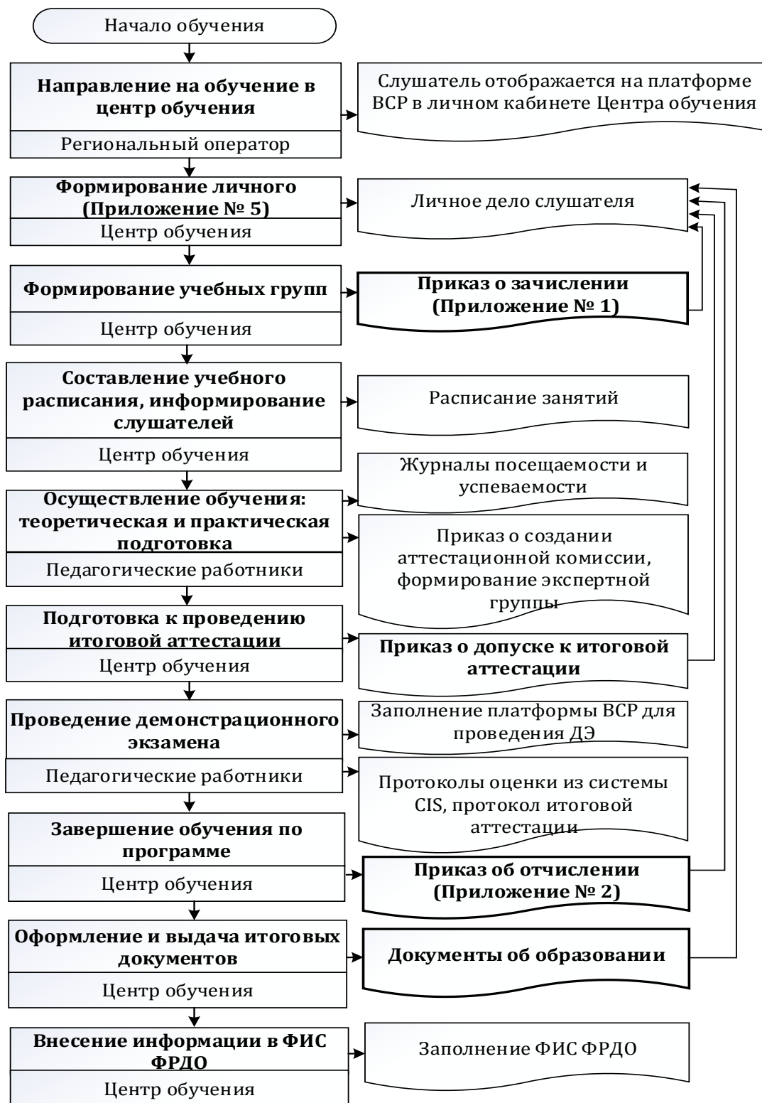
Рис. 3. Порядок выполнения действий по организации обучения в центрах обучения

Порядок выполнения действий по организации обучения в центрах обучения (рис. 3):