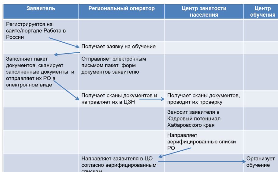
Рис. 1. Алгоритм организации зачисления на обучение граждан, ищущих работу

Списки граждан, прошедших верификацию, направлялись в центры обучения. Региональный оператор (ХК ИРО) тесно взаимодействовал с комитетом по труду и занятости, центрами занятости населения края в соответствии с отработанным алгоритмом (рис. 1).